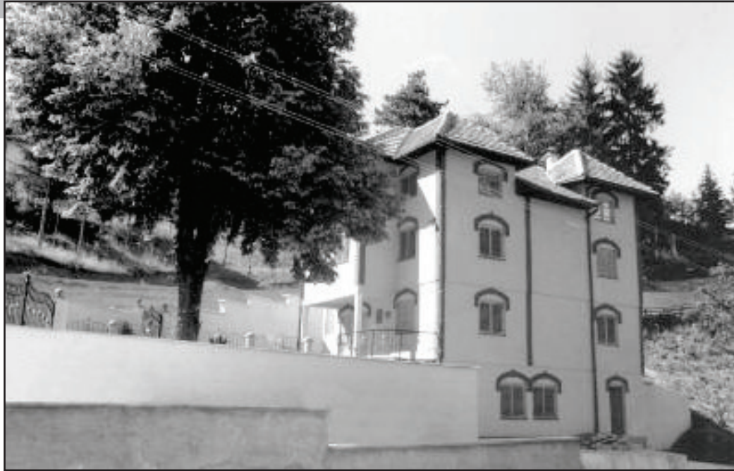
Na mjestu gdje se nekada nalazila medresa, u kojoj je šejh hafiz Kjazim podučavao, danas je zgrada muzeja sa stalnom etnološkom, historijskom i umjetničkom postavkom.

Ono "Ja" prošlo je kroz tamnu pomračinu. Onom našem dijelu "Ja" iz prve faze, u drugoj fazi pridružilo se tijelo i to je naš život ovdje. Materijalizacija onog našeg "Ja" je putem tijela. To je naš život, ovdje i sada. Na ovom svijetu sve dolazi i prolazi, i tako se sve kreće prema tamnoj beskrajnoj pomračini. Ko odlazi tamo više se ne vraća i o njemu više nemamo nikakvih vijesti. Komunikacija između nas je prekinuta. Naši očevi, majke, rodbina, poznanici otišli su tamo, i pred našim očima se gube, dok ne dođe momenat pa da i mi moramo tamo krenuti. Kad čovjek počne o ovome misliti, tada zaboravlja sve