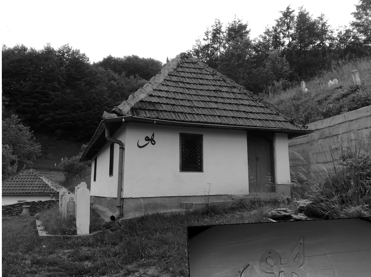
Turbe šejh Hasan-Hilmi babe i njegovog evlada u Živčićima-Vukeljićima

važni i uticajni ljudi i ulema iz Sarajeva, Fojnice, Kiseljaka, Travnika, a i šire, tražeći od njega savjet i pouku kako za vlastite, tako i za državno-društvene potrebe. Neki od tih značajnih ljudi su bili reis Džemaludin efendija Čaušević, šejh hadži Husni efendija Numanagić (primio tarikat od šejh Hasana), šejh Osman efendija Nuri (primio tarikat od šejh Hasana), čuveni muderris Abdullah efendija Bajrić zvani Mula efendija (šejh Hasan ga postavio za šejha u nakšibendijskoj Gaziler tekiji u Sarajevu), kao i mnogi drugi. Za šejh Hasan babu je slovalo da u tarikat prima samo muderrise i muftije. Zahvaljujući upornošću i istrajnošću u tarikatskom djelovanju kojom se šejh Hasan efendija Hadžimejlić pored ostalih vrlina odlikovao, zaživjele se tekije u Visokom, Travniku, Konjicu, ali i u drugim bosanskohercegovačkim gradovima.